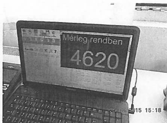
Telephelyen történő mérések